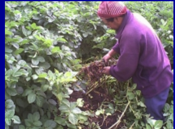
Muestras de daño