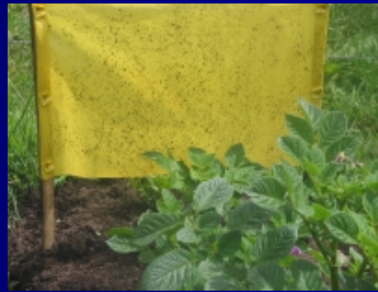
Manejo de minadora