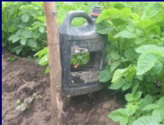
Monitoreo de polilla